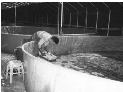
&lt;그림 45&gt; 육상수조직 양식장(북면 덕천리)